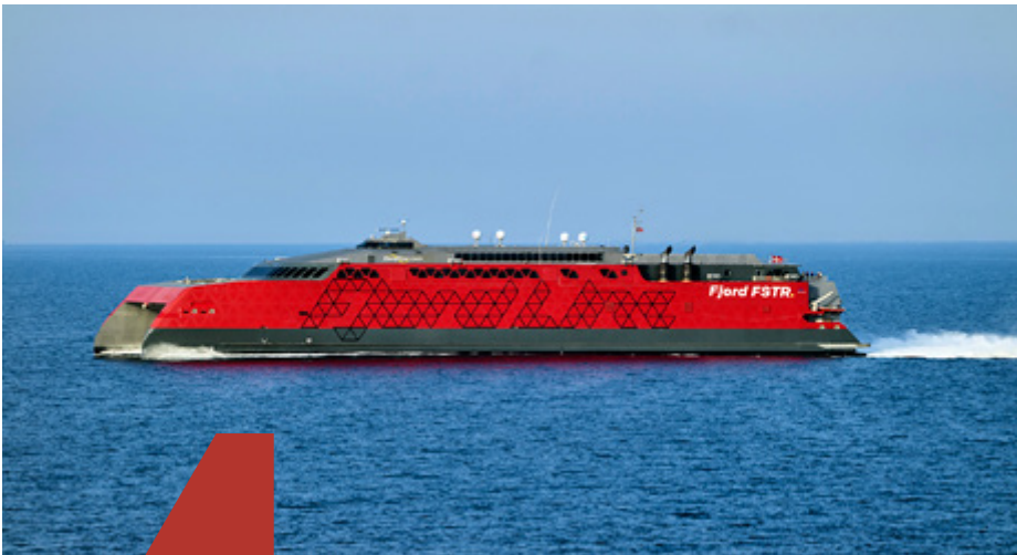
Fjord Line havde ved en fejl givet en navigatør løn som overstyrmand.