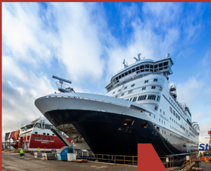
DFDS 'CROWN SEAWAYS' lå i dok i fire uger, hvor hele kabyssen blandt andet blev udskiftet. Der blev ligeledes udført planlagte opdateringer og vedligehold på store dele af skibet.