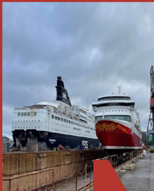
DFDS 'CROWN SEAWAYS' og Fjordline 'STAVANGERFJORD' side om side i dok på FAYARD. For begge skibe gælder det, at der blandt andet blev udført diverse vedligehold, så de er trimmet og klar til højsæsonen.