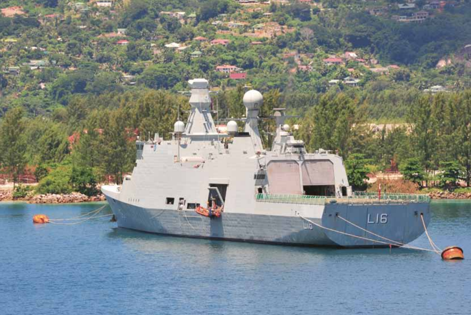
Absalon er her jagttaget fra et passerende krydstogtskib i december ved Victoria, Seychellerne. Under skibets besøg medio januar på Seychellerne var især de ombordværende 25 formodede pirater i søgelyset.

vi i de nævnte sager med Kenya og kontaktede nabostater for at få dem til at hjælpe til. Den anden ting er at sikre afsoningskapaciteten, en fængselskapacitet, og der arbejdede vi også sammen med landene i regionen, svarede Villy Søvndal uddybende i Folketinget og tilføjede: