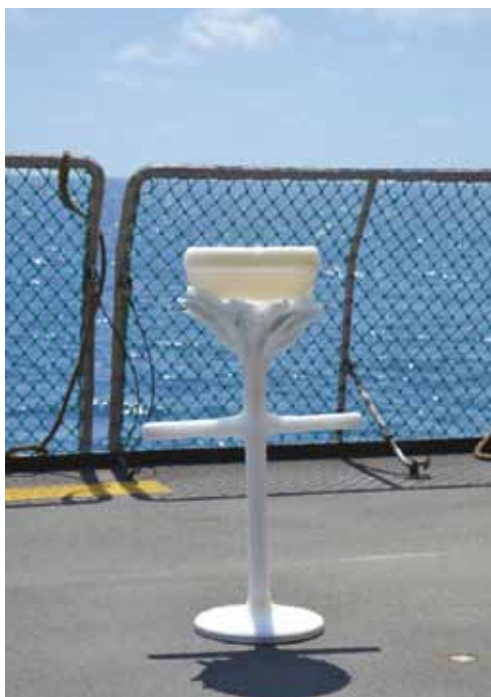
Den special-konstruerede døbefont af is klarede at holde på formerne før og under dåben. Herefter måtte den overgive sig til solens varme.