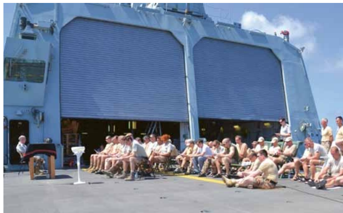
Gudstjeneste og dåb på helikopterdekkeket på 'Absalon'.