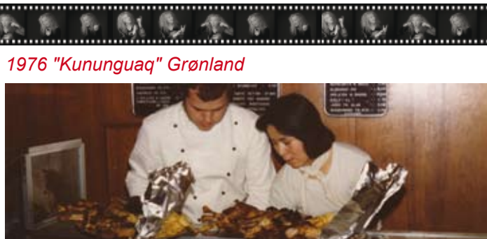
1976 "Kununguaq" Grønland

Tiden i Søværnet blev brugt på Orlogskutteren Teisten , Bevogtningsfartøjet Daphne , Transportfartøjet Sleipner og Torpedobåden Søridderen . Jeg husker tilbage på denne tid med stor glæde og mange minder. Det meste af tiden gik med sejlads rundt i alle kroge af de