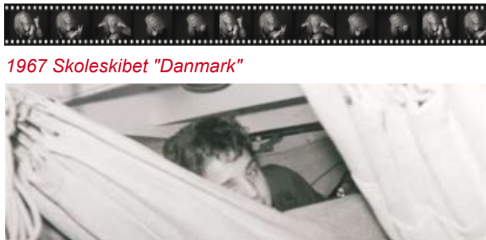
1967 Skoleskibet "Danmark"

Som ung havde jeg et ønske om at komme til søs, og dermed startede karrieren til søs i 1967 ganske traditionelt med søfartsskole i Sønderborg, efterfulgt af et togt på Skoleskibet Danmark. Herefter stod den på styrmandsaspirant i Mærsk, der blev fulgt op af en kokkeaspirant samme sted.