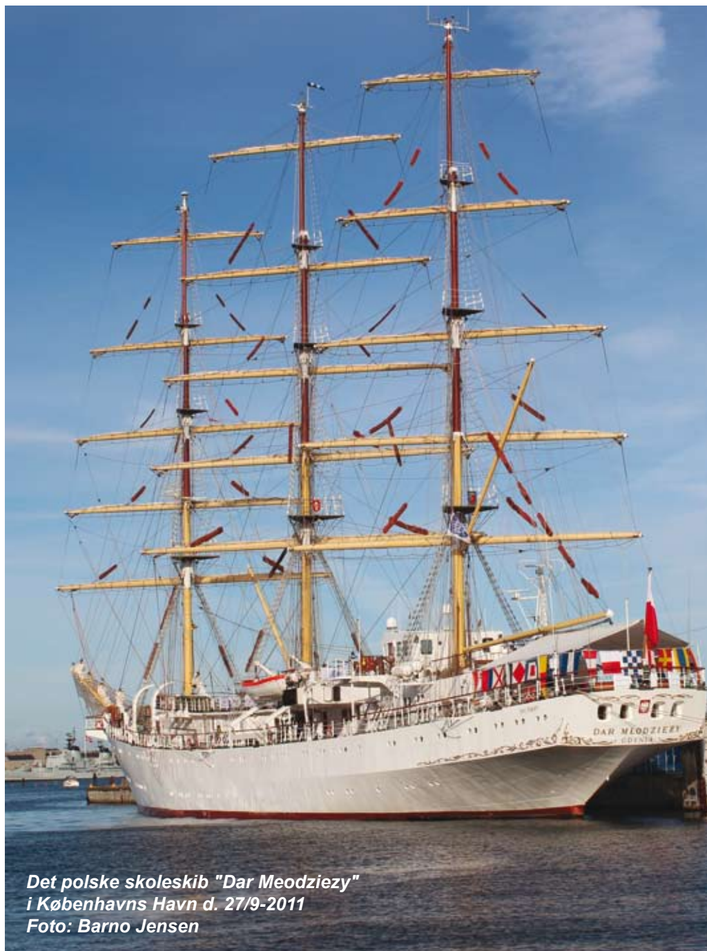
Det polske skoleskib "Dar Meodziezy" i Københavns Havn d. 27/9-2011